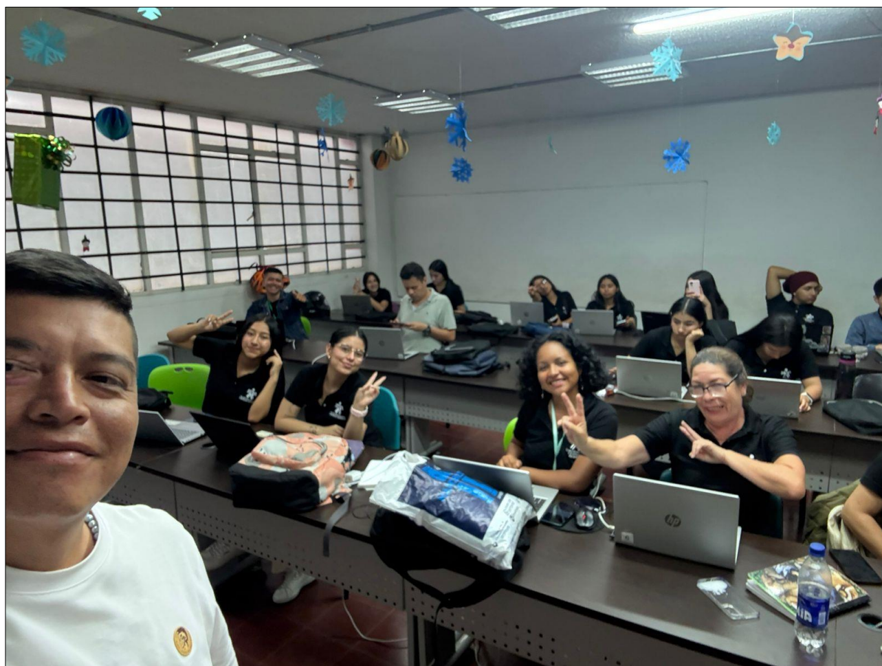
Figure 1

Registro asistencia y participación formación